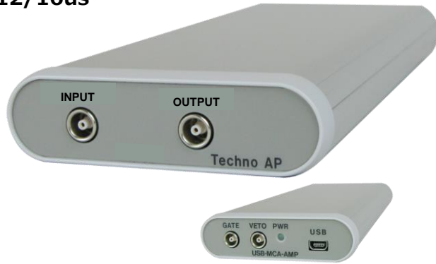
APG7305A USB-MCA-amp (上図：全面、下図：背面)