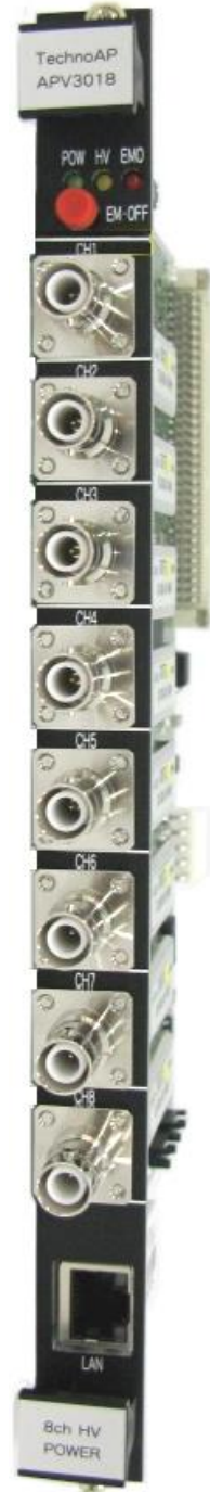
APV3018 VME型8CH 高圧電源ボード