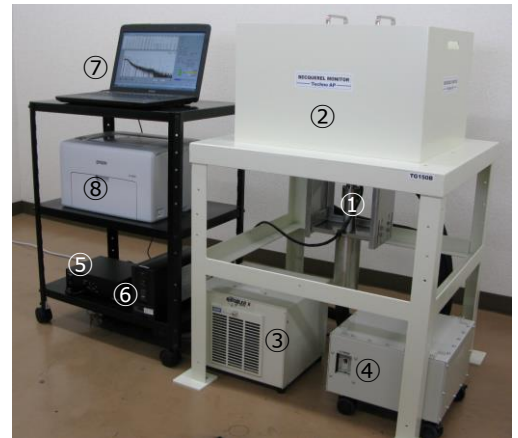
TG150Bベクレルモニター

※1 バックグラウンド環境、測定時間、比重(充填率)によりこれらの値は異なります。 ※2 オプションになります。 記載内容は予告なく変更することがあります。