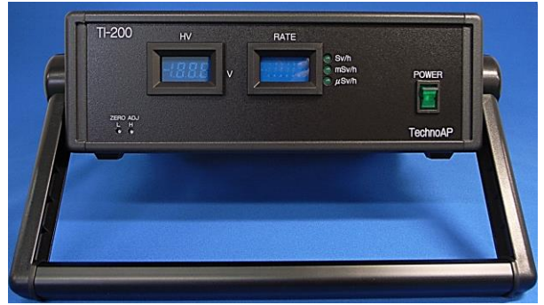
TI-200 前面パネル ※ハンドルを立てた状態