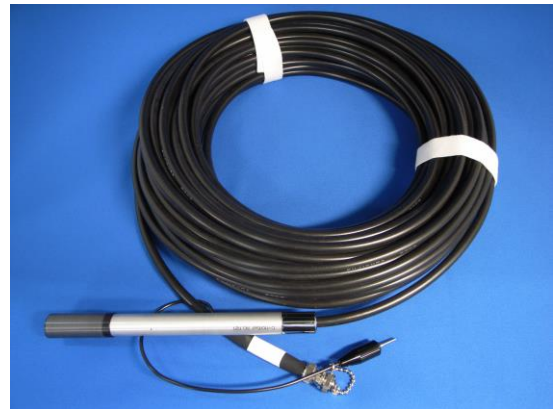
円筒形電離箱（6ml）と専用ケーブル