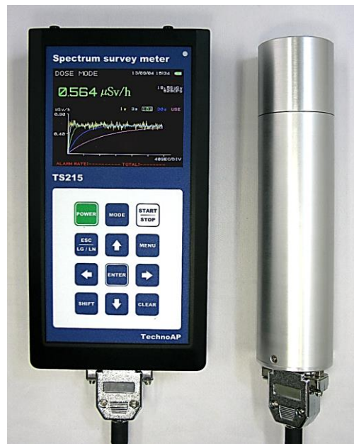
TS215 (左 : 本体、右 : 検出器)