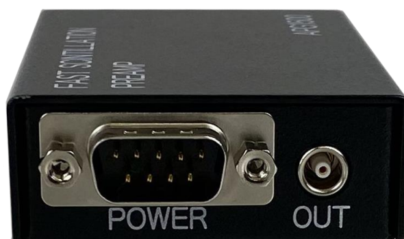
図4 POWER コネクタと OUT コネクタ