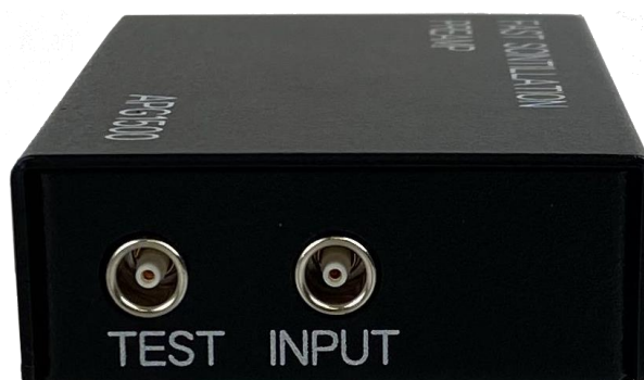
図3 INPUT コネクタと TEST コネクタ