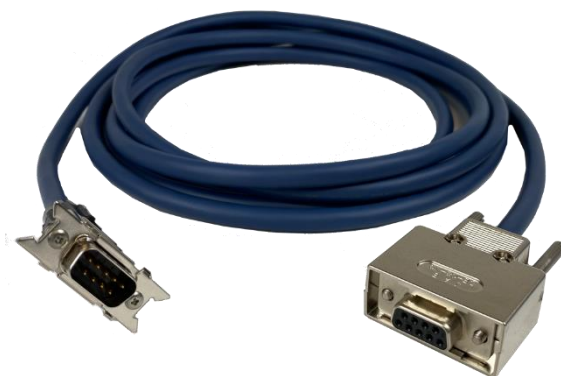
図 2 付属プリアンプ電源ケーブル (Dsub9pin コネクタ、3m)