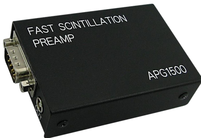
図 1 APG1500