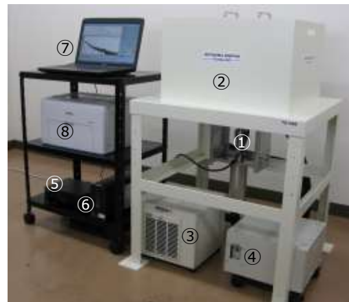
TG150Bベクレルモニター

※1 バックグラウンド環境、測定時間、比重(充填率)によりこれらの値は異なります。 ※2 オプションになります。 記載内容は予告なく変更することがあります。