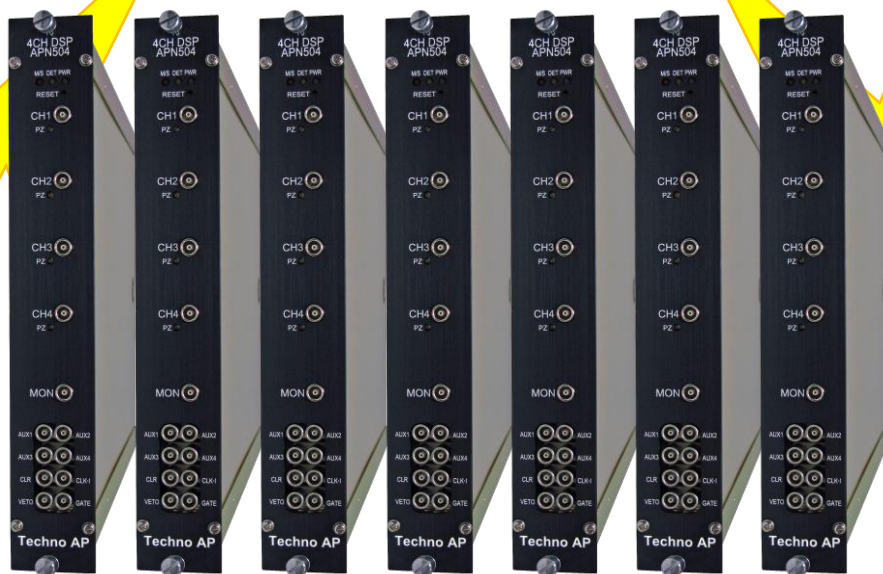
SSD25素子検出器用データ収集システム